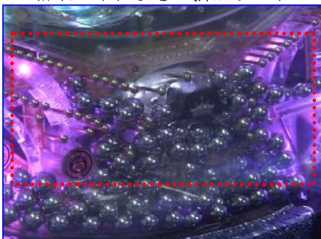
磁石ゴトによる玉掛かりゴト