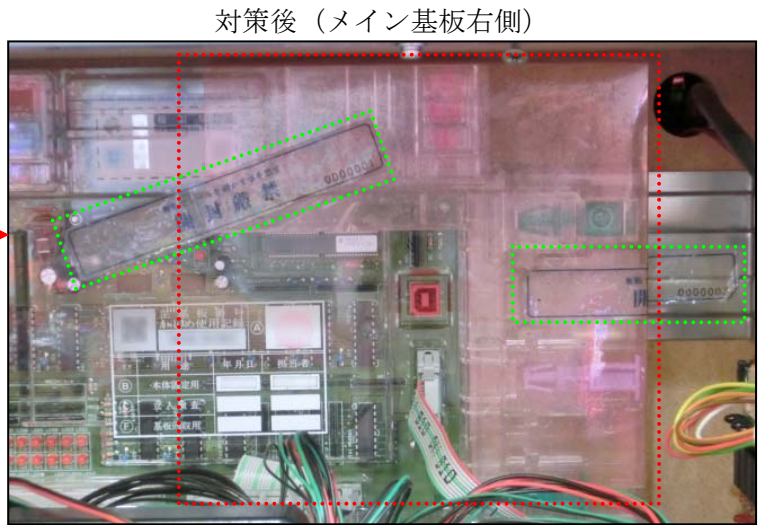
対策後（メイン基板右側）