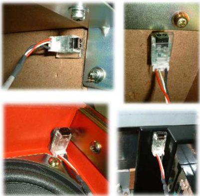
センサー部取付け例