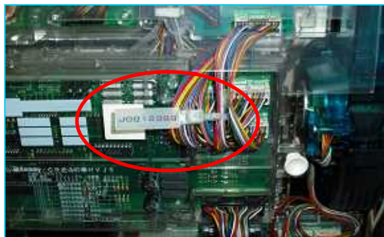
パチンコ遊技機の対策例